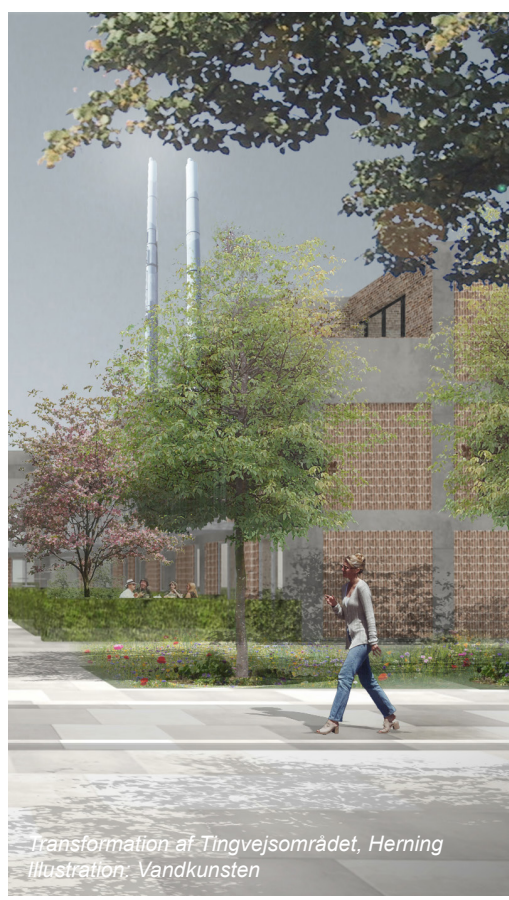
Transformation af Tingvejsområdet, Herning Illustration: Vandkunsten