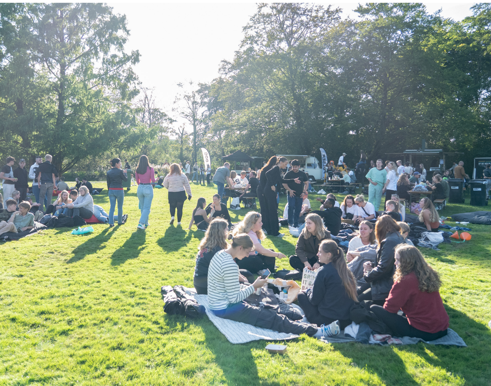
Student Cup i Sdr. Anlæg, september 2023

Fordi alle børn og unge er værdifulde og skal have mulighed for et godt liv. Og fordi vi synes, det er vigtigt, at børn og unge bliver i stand til at indgå i fællesskaber og løse de opgaver, fremtidens samfund har brug for.