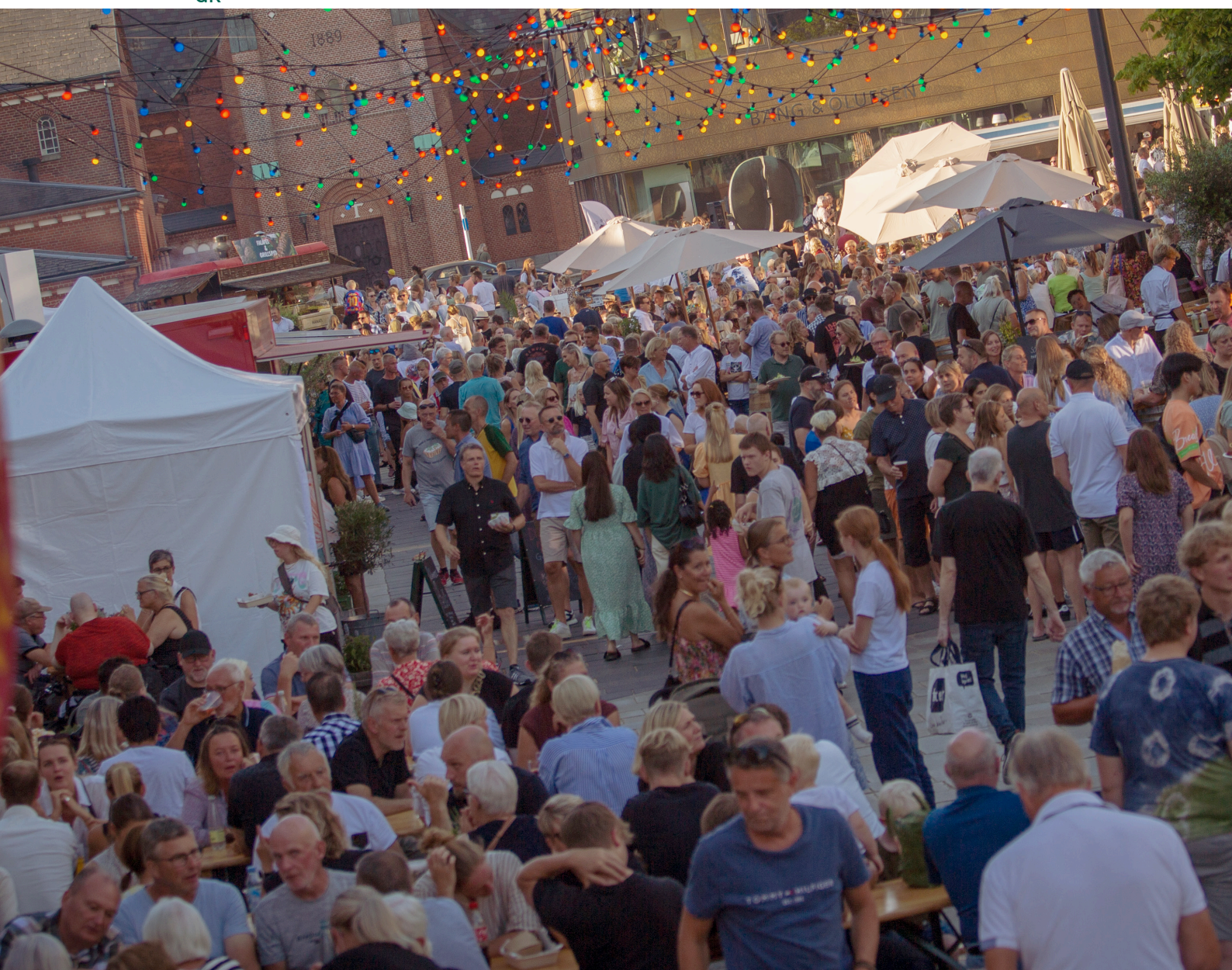
Streetfood Festival på Torvet i Herning, august 2023

I forbindelse med den offentlige høring afholdes et online-borgermøde, hvor Planstrategien vil blive præsenteret, og der vil være mulighed for at stille spørgsmål. Mødet afholdes torsdag den 7. marts kl. 19.00 . Yderligere oplysninger om mødet vil fremgå af Herning Kommunes hjemmeside www.herning.dk