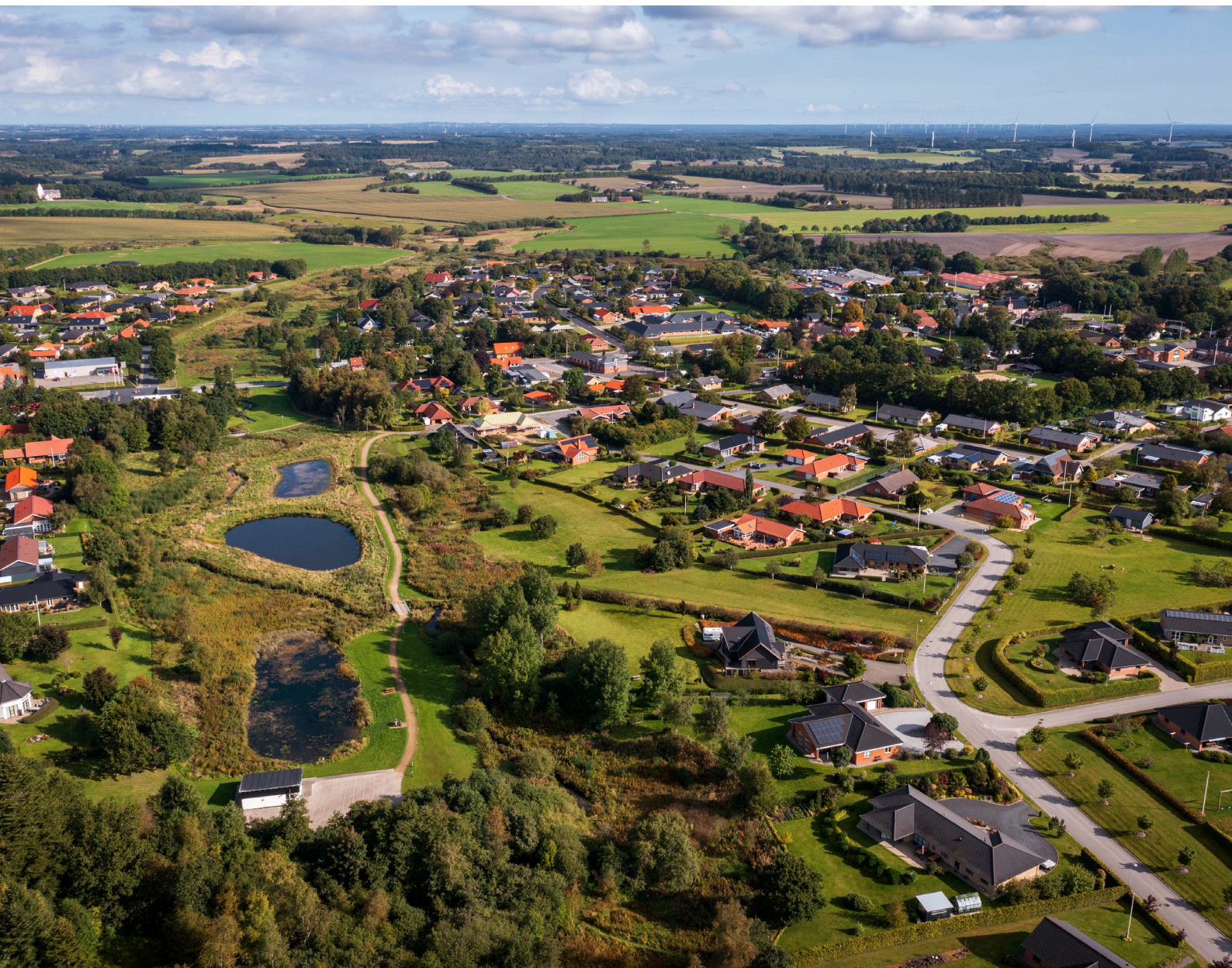
Attraktive lokalsamfund, Sørvad

Og hvordan kan vi tage udgangspunkt i de enkelte lokalsamfund og kvarterers identiteter, styrker og behov i en fremtidig udvikling?