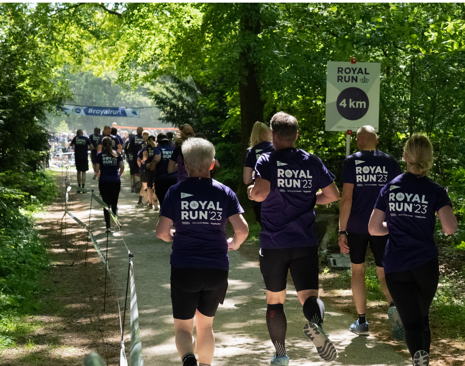
Royal Run, maj 2023

Hvordan kan vi i fællesskab med borgerne, foreningerne, interesse-organisationerne og erhvervslivet finde løsninger, der sætter lokale ressourcer i spil og understøtter livskvalitet for den enkelte?