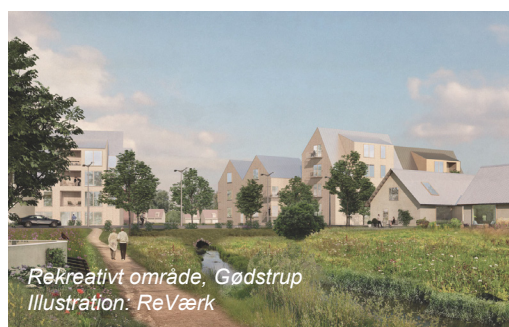
Rekreativt område, Gødstrup Illustration: ReVærk