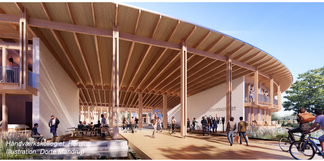
Håndværkskollegiet, Herning Illustration: Dorte Mandrup