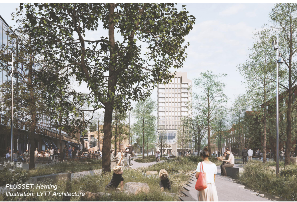
PLUSSET, Herning Illustration: LYTT Architecture