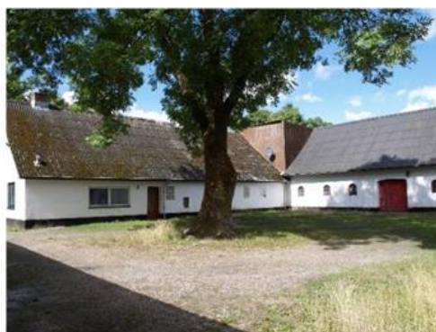
Illustration af facader, der ønskes