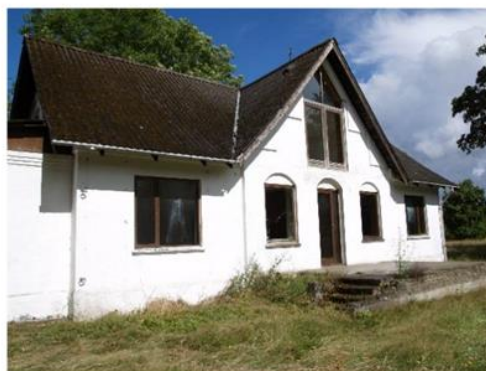
Illustration af facader